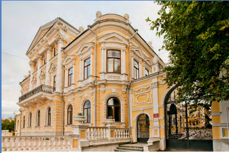
Пермский краеведческий музей